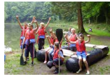
• Schatzsuche und Floßbau mitten in der Eifel »