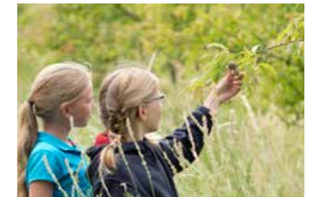
• Auf Entdeckertour mit dem Förster »