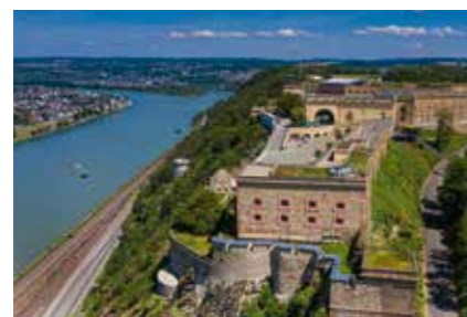
• Jugendherberge Festung Ehrenbreitstein »