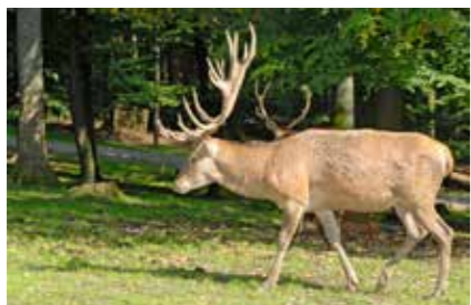
• Spurensuche im Pfälzer Wald »

Ob im Team beim Geocaching, bei gruppendynamischen Spielen, unterwegs als Naturforscher, beim Balancieren auf der Slackline, beim Monkeyklettern oder am Lagerfeuer im Wald – draußen in der Natur gemeinsam echte Abenteuer erleben, stärkt nachhaltig die Klassengemeinschaft und das WIR-Gefühl.