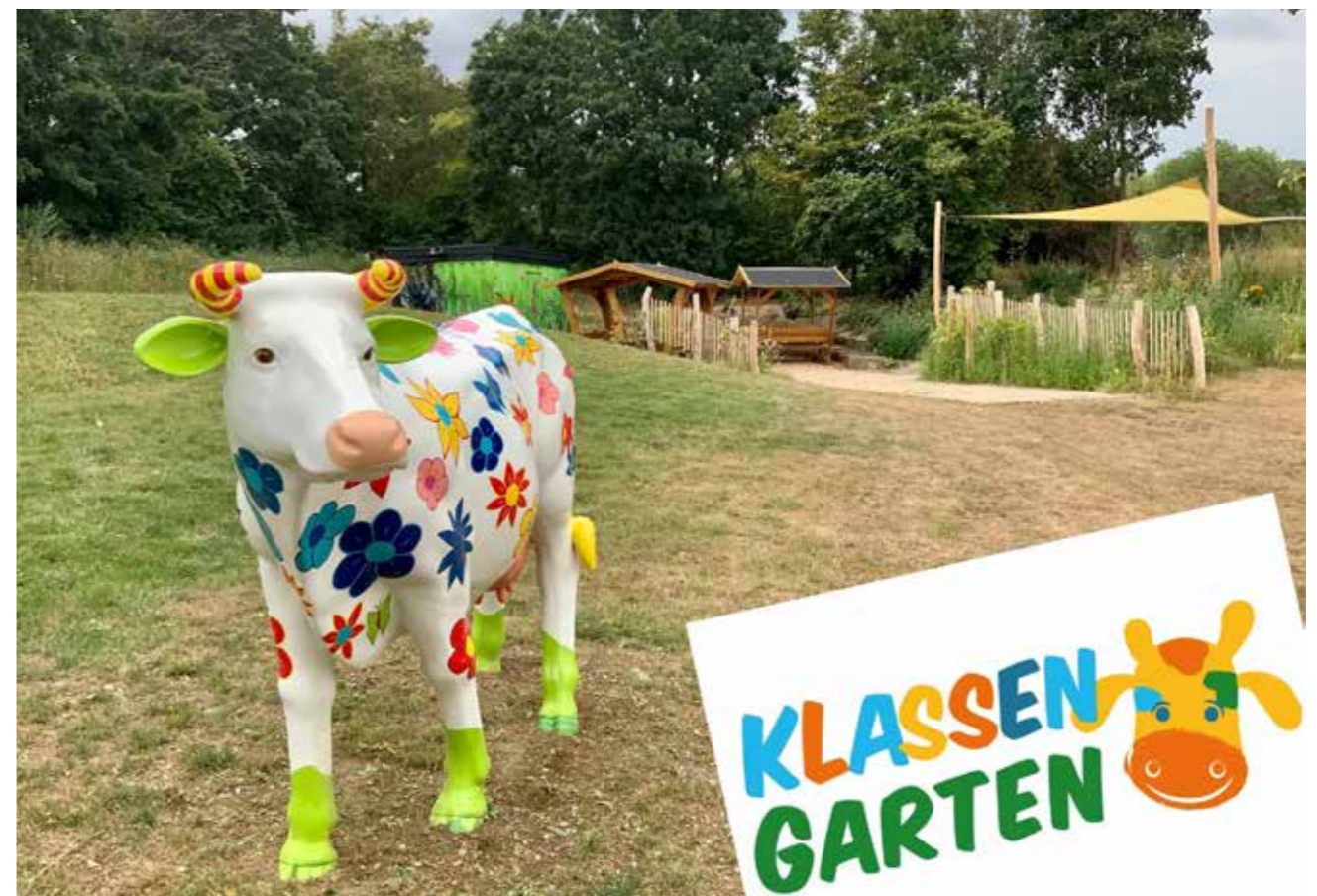
• In der Jugendherberge Bad Neuenahr-Ahrweiler: Der „Klassengarten“ mit 6 wertvollen und spannenden Programmen zum Thema Natur und Umwelt »