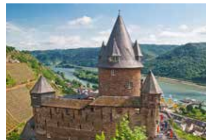
• Jugendherberge Burg Stahleck »