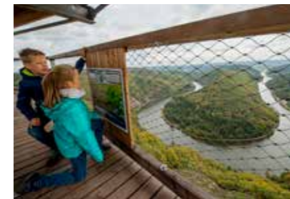
• Baumwipfelpfad Saarschleife – Es geht hoch hinaus! »