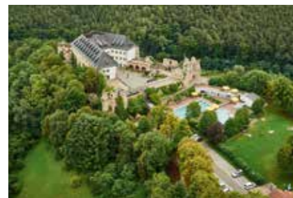
• Burg-Jugendherberge Altleiningen »

Sich einmal wie Ritter und Burgfräulein fühlen, Ritter der Tafelrunde sein bei festlichem Gelage, eine Zeitreise ins Mittelalter erleben oder spannende Ritterspiele spielen? Dann sind Sie in diesen Jugendherbergen genau richtig: