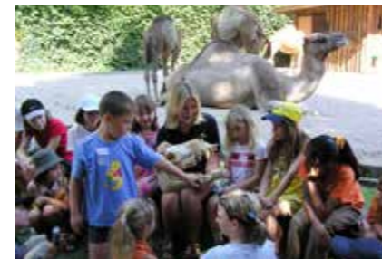
• Tierisch gute Erlebnisse im Landauer Zoo »