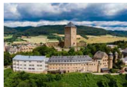
• Jugendherberge Burg Lichtenberg »