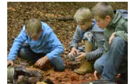
• Survival Erlebnis im Nationalpark Hunsrück-Hochwald »