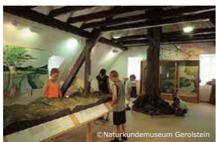
• TerrAbenteuer: Faszination Erde in Gerolstein »