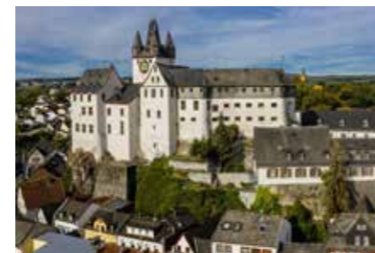
• Grafenschloss-Jugendherberge Diez »