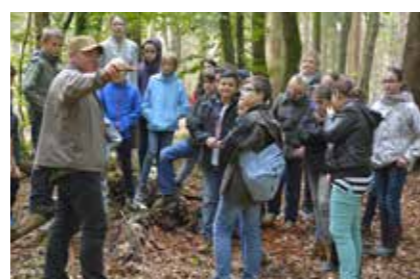
• Survival light-Erlebnis in Wolfstein »