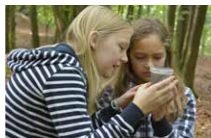
• Waldentdecker in der Südeifel »