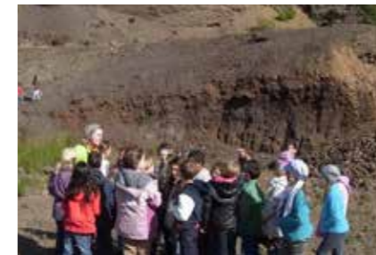
• Vulkanismus „live“ im Outdoor-Klassenzimmer »