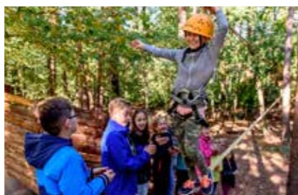
• Slackline & Co. im Westerwald »